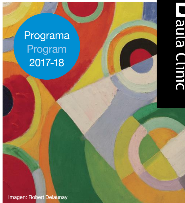
Imagen: Robert Delaunay

Consell Català de Formació Continuada Professions Sanitàries